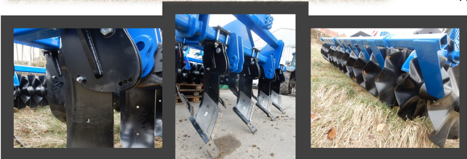
3 Réglages de l'angle d'entrée