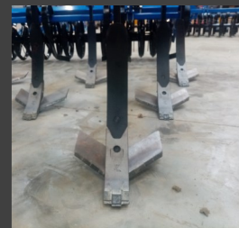
Soc et aileron Carbure (350 mm)