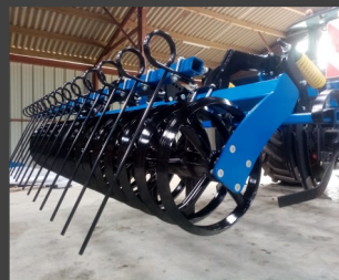
Herse peigne \varnothing 13 mm